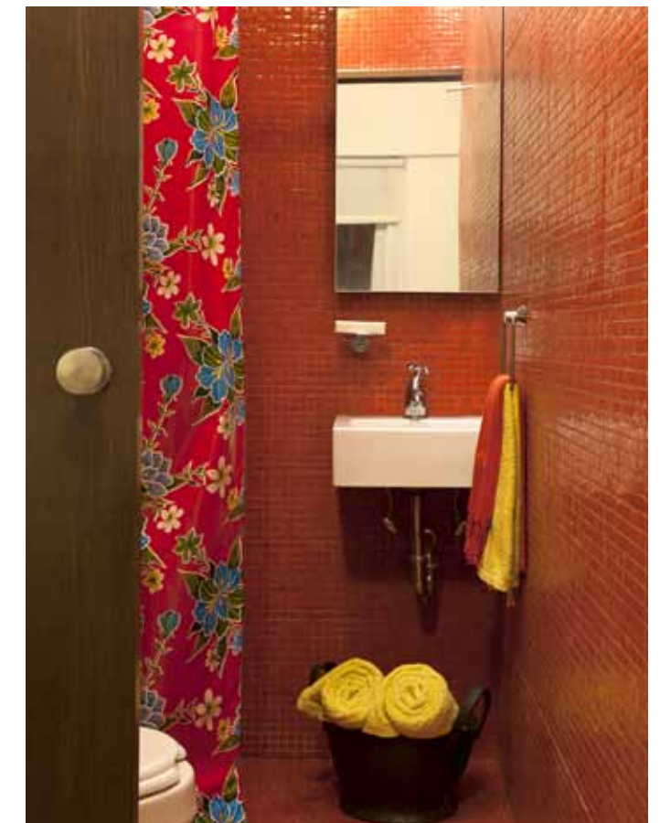
En el baño de visitas se colocó un acabado de mosaico veneciano color rojo. Para complementar la alegría de este espacio se colocó una cortina de plástico —utilizando plástico del característico mantel de fonda— floreado en tonos rojos, azules y amarillos.