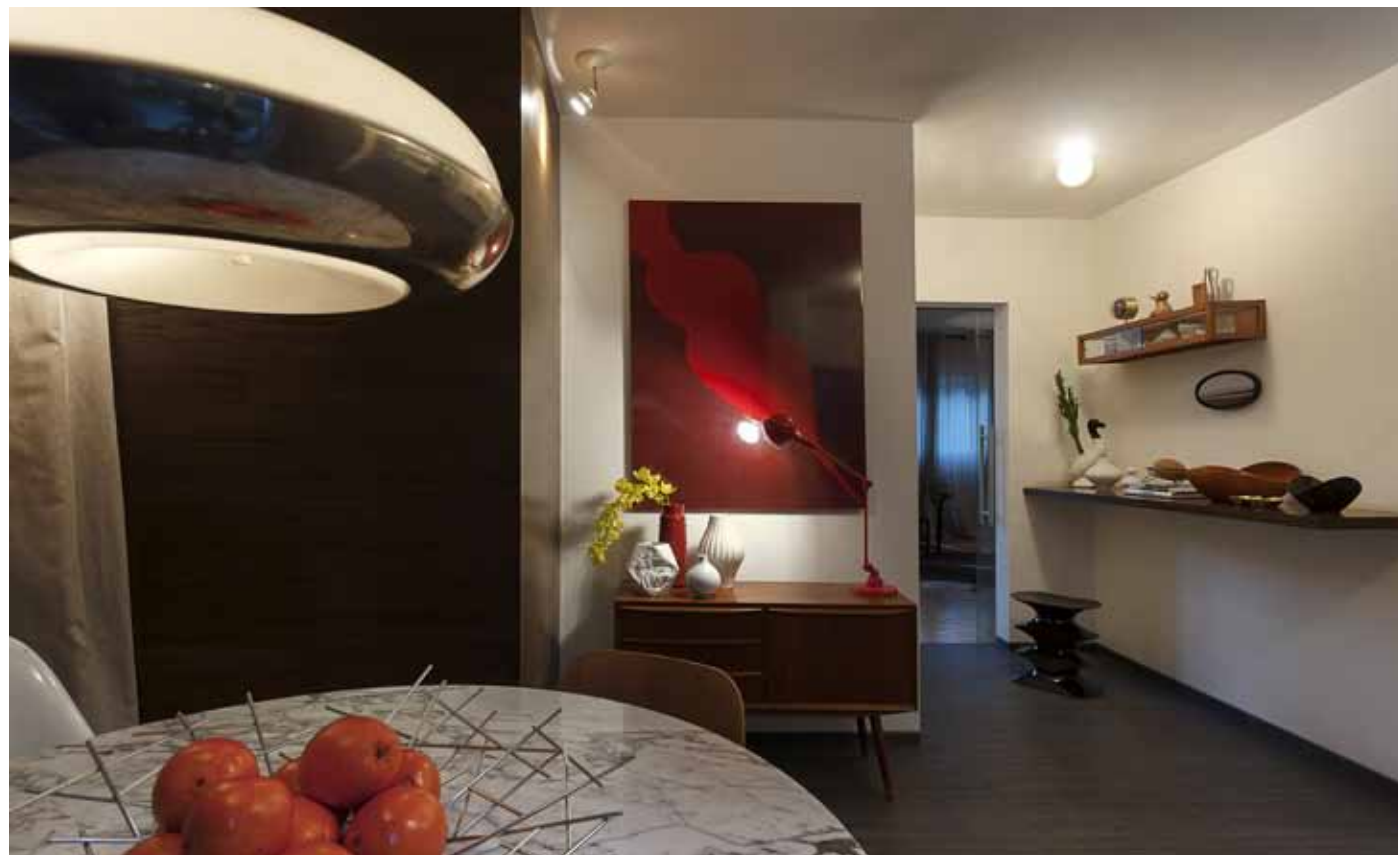
Otro cambio en el programa fue ubicar el comedor dentro de la cocina para lo que se hizo una división ligera formada por tiras de madera e hilos de lana que recuerdan a un telar. La puerta de servicio se cubrió con una cortina para hacer más cálido el ambiente y enfatizar su importancia dentro del espacio.