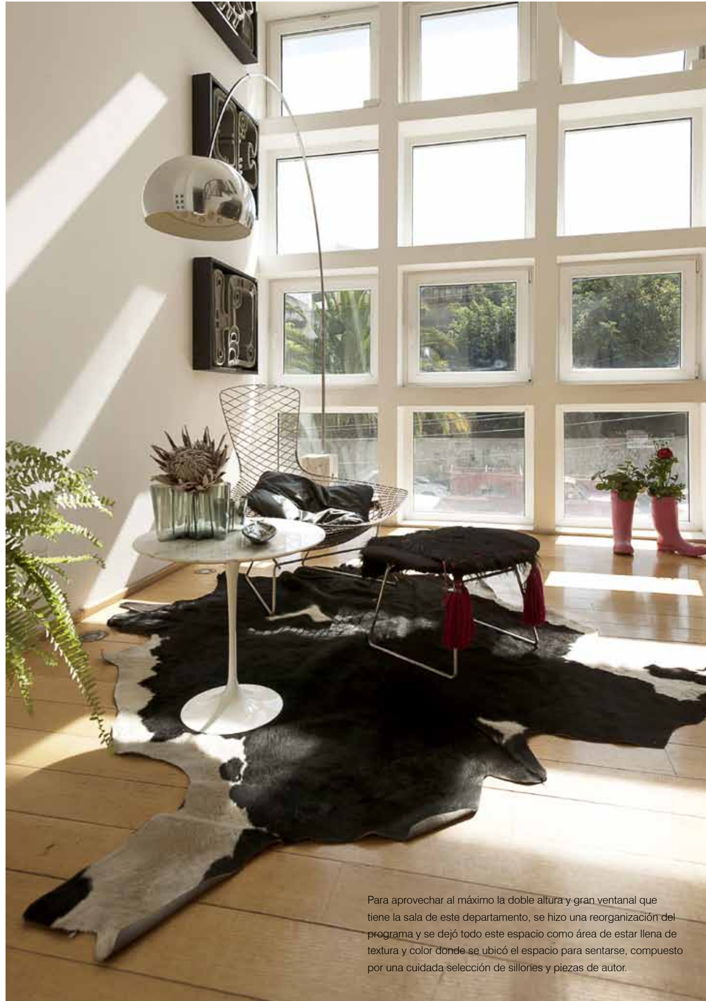
Para aprovechar al máximo la doble altura y gran ventanal que tiene la sala de este departamento, se hizo una reorganización del programa y se dejó todo este espacio como área de estar llena de textura y color donde se ubicó el espacio para sentarse, compuesto por una cuidada selección de sillones y piezas de autor.